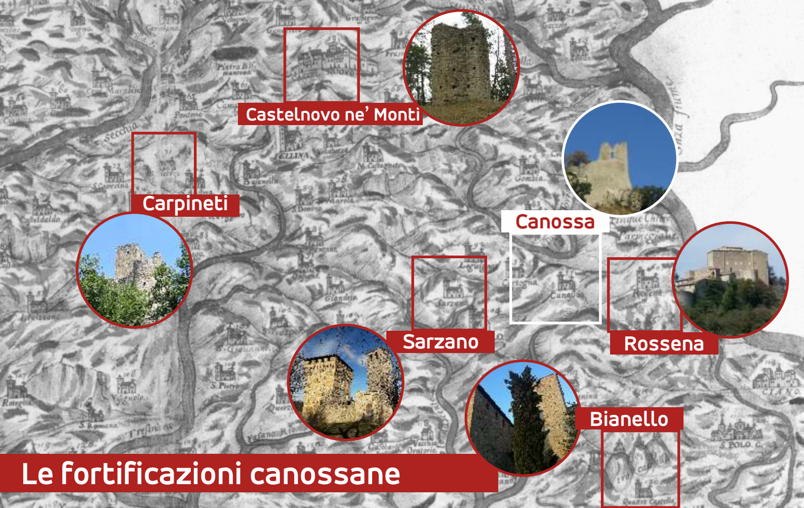
Castelnuovo ne' Monti